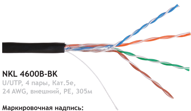
NKL 4600B-BK U/UTP, 4 пары, Кат.5е, 24 AWG, внешний, PE, 305м

Кабели 4-й серии обладают отличными характеристиками при разумной цене, что делает их оптимальным выбором для построения сетей в проектах, не требующих системной поддержки. Данная модель поставляется в картонных коробках.